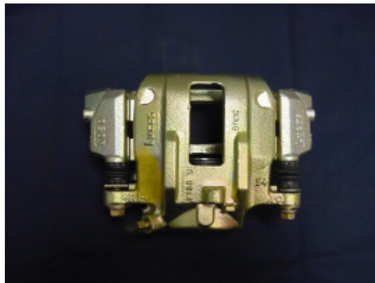
Caliper flotante de un pistón.